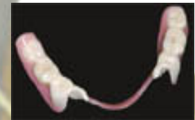
Kein silberfarbenedes Metall sichtbar.

Voll-Keramik ist neben der Biokompatibilität bei Biomedical Dental auch kostengünstig, da teure Edelmetalle wegfallen.